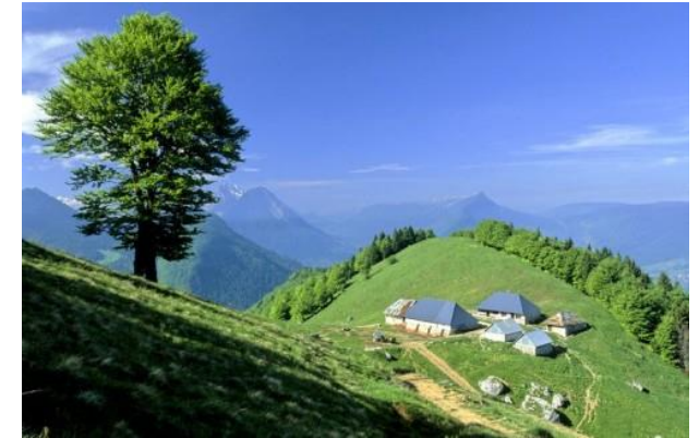
Bellecombe-en-Bauges (Savoie). Chalets d'alpage du Sollier (1 450 m), vue d'ensemble