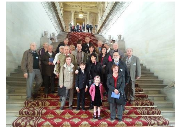
La visite du Sénat